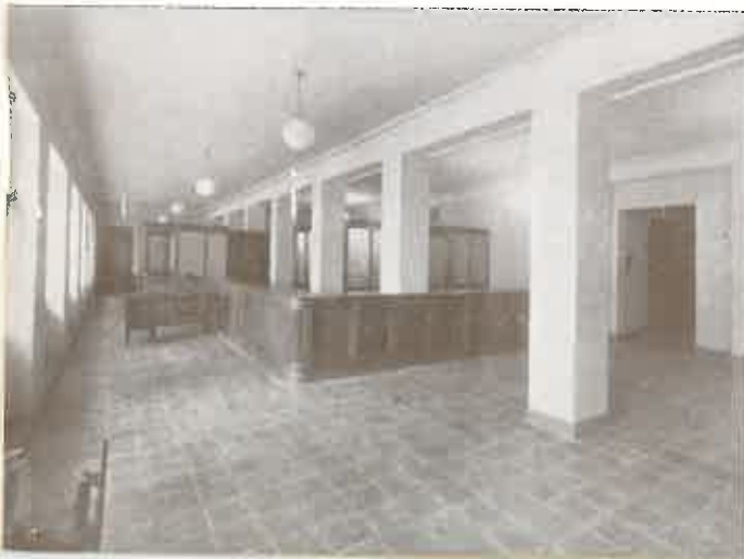
MONTE DE PIEDAD