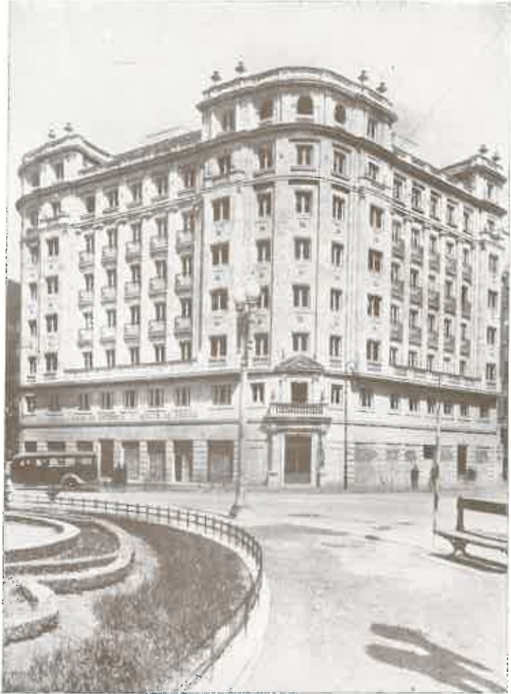
SUCURSAL DE VALLADOLID

En la calle de Santiago, ante el Campo Grande y frente al monumento que Valladolid levantó a su hijo preclaro, el gran poeta Zorrilla, se yergue este suntuoso edificio, símbolo del poder taumátúrgico del ahorro, en cuya planta principal han quedado instaladas las oficinas de nuestra Sucursal.