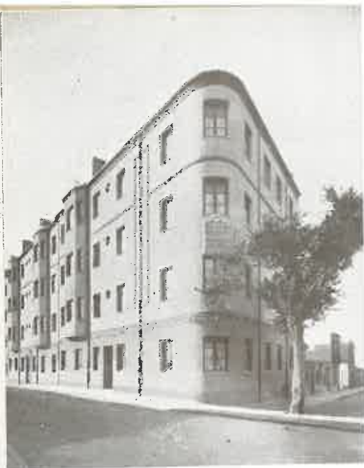
GRUPO DE CALATAÑAZOR