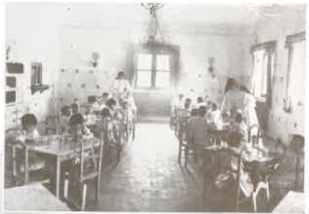
Grupo de niñas →