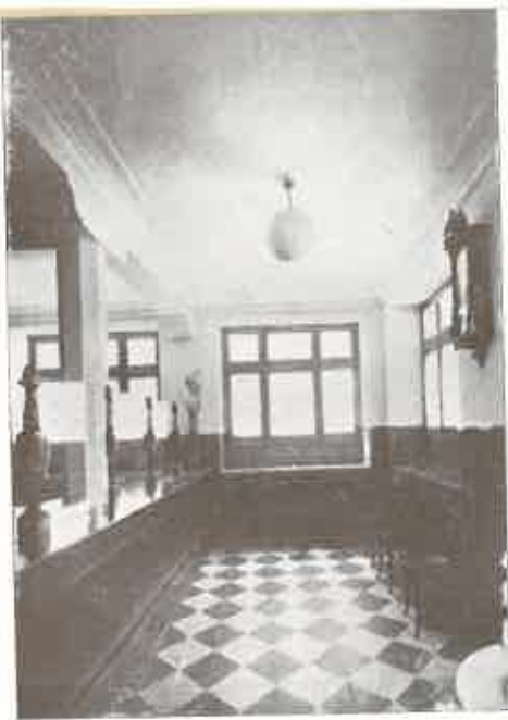
SUCURSAL DE BENAVENTE (PATIO DE OPERACIONES)