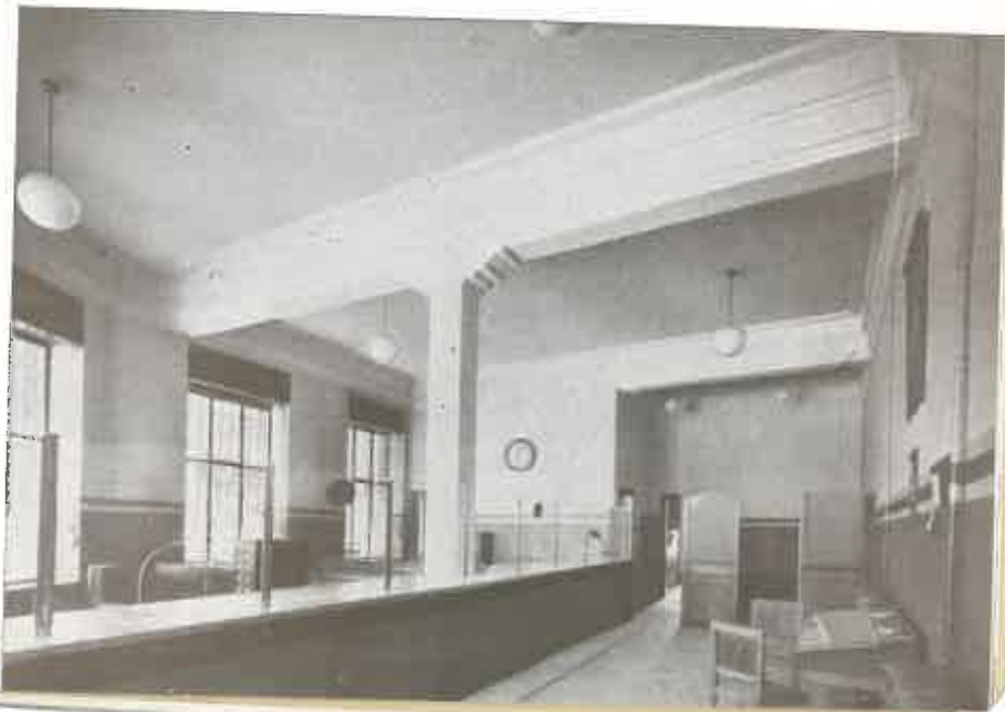
PATIO DE OPERACIONES Y OFICINAS