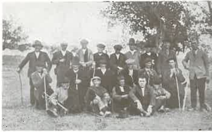
VECINDARIO DE BERROCAL DE HUEBRA