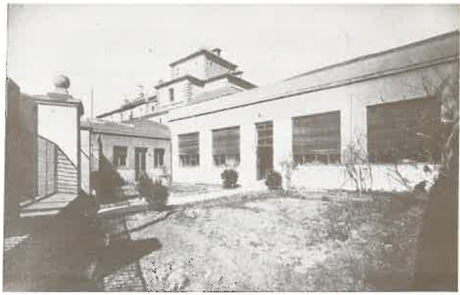
ASOCIACION SALMANTINA DE CARIDAD (ALBERGUE DONADO POR LA CAJA)