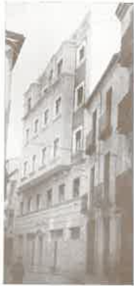
Zamora.—Grupo de viviendas.