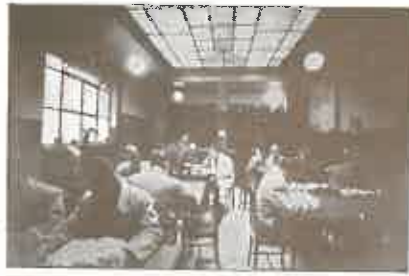
Biblioteca Popular en el Pasaje de la Caja de Ahorros.