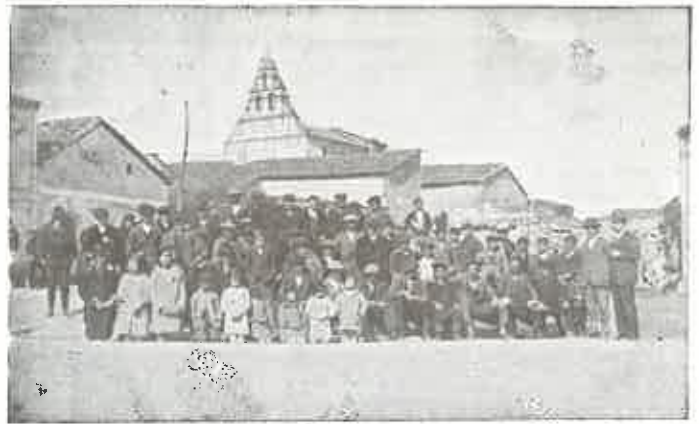
VECINDARIO DE FORFOLEDA