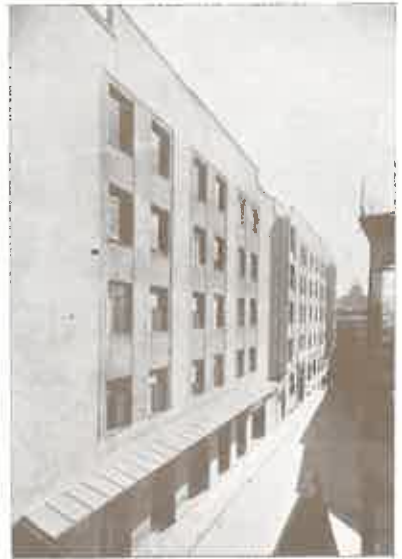
Salamanca. Hotel Pasaje.