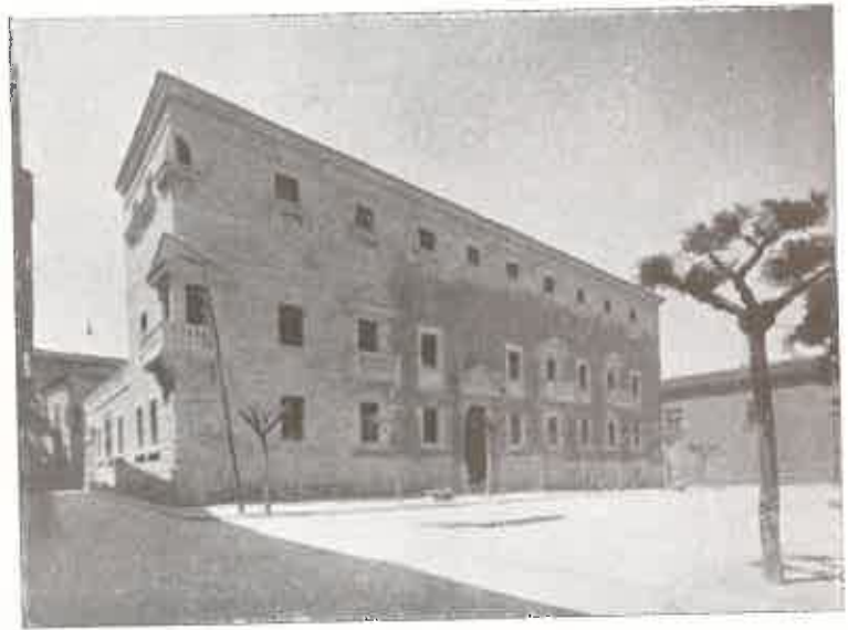
Antiguo edificio conocido con el nombre de "Cuartel del Conde", que fué adquirido por la Institución y magníficamente restaurado.