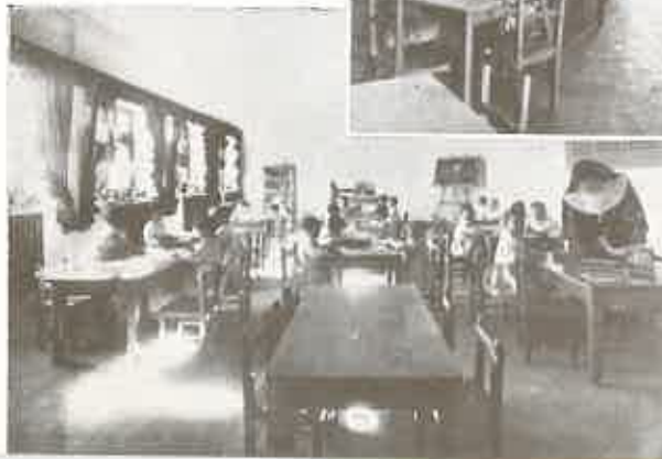
← Grupo de niños