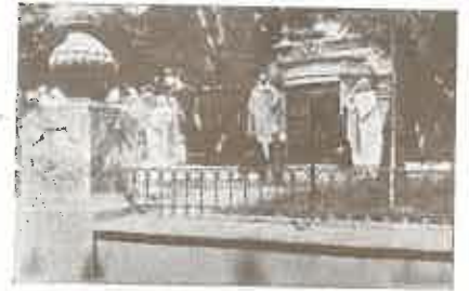
Biblioteca de verano instalada en el Campo de San Francisco.