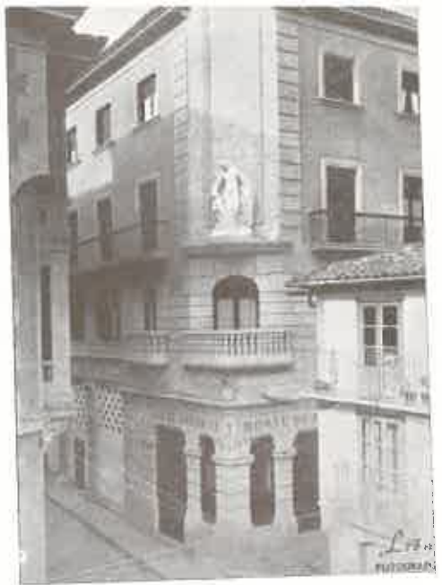
SUCURSAL DE BEJAR (FACHADA)