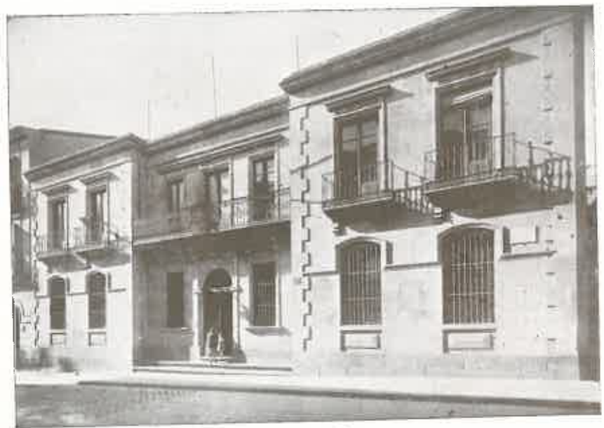
GRUPO DE CALLE ZAMORA