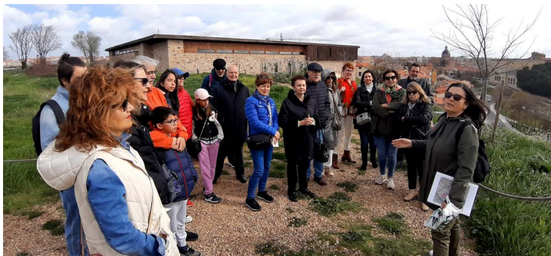
Culturales Cerro San Vicente - 31 mayo 2023