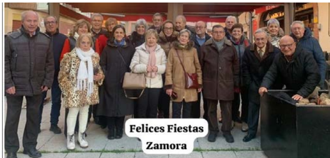
NAVIDAD 2023 ZAMORA