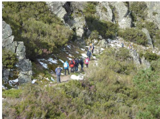
DEL PASO DE LOS LOBOS A MONSAGRO – 21 abril 2022. Distancia: 12 km.