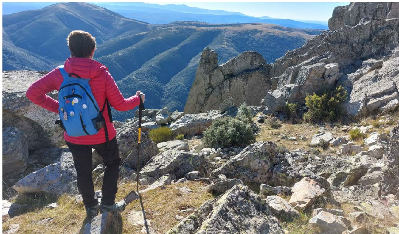
RUTA NAVARREDONDA DE LA RINCONADA/CUEVA DE LA MORA/LA BASTIDA. FECHA: 8 DE FEBRERO DE 2.022. Distancia: 13 km.