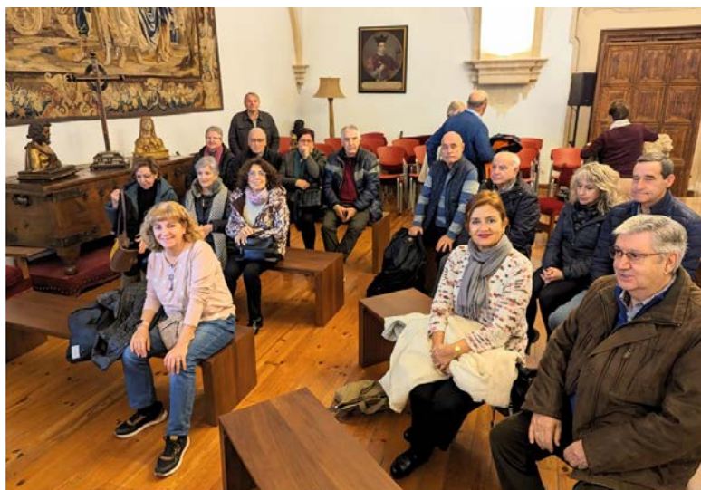
Casa Museo Unamuno - 24 noviembre 2023