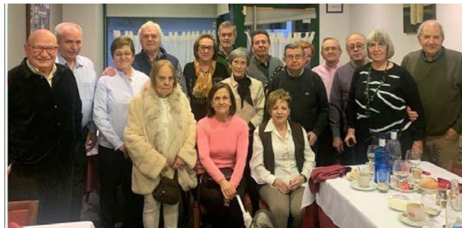
NAVIDAD 2022 ZAMORA