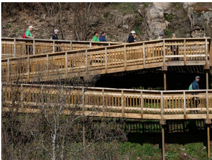
PASARELAS DEL MONDEGO. FECHA: 20 de marzo de 2023. 12.5 km