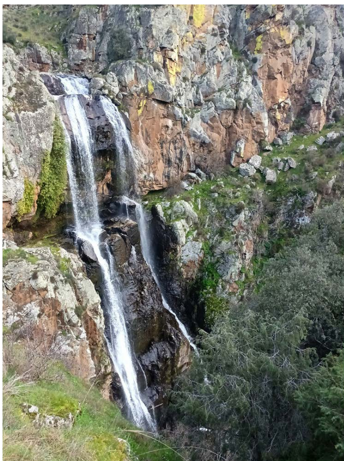
RUTA BEMPOSTA-FAÍA DA ÁGUA ALTA. 26 de enero de 2023. 10,2 km