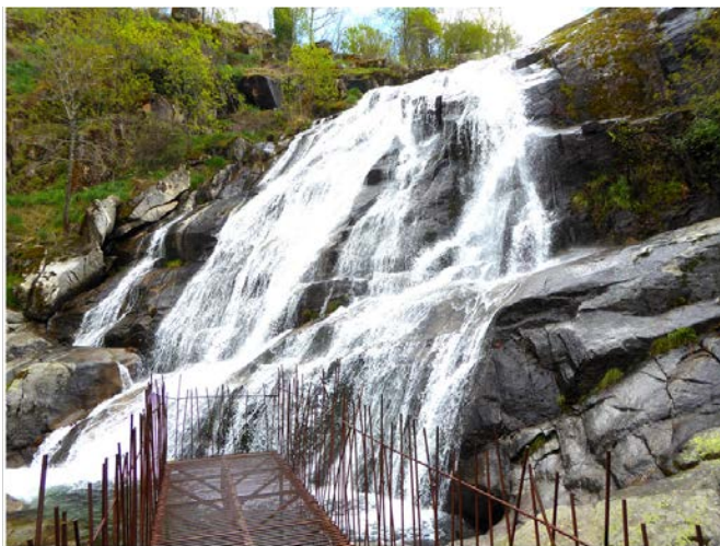
DE TORNAVACAS A JERTE y GARGANTA DE LOS PAPÚOS. 31 de marzo de 2022. Distancia: 14 kms.