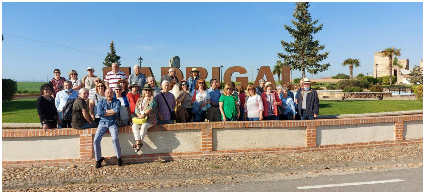
Culturales Madrigal de las Altas Torres 2023