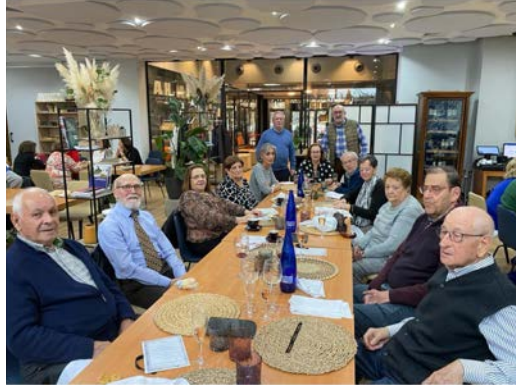
NAVIDAD 2023 VALLADOLID