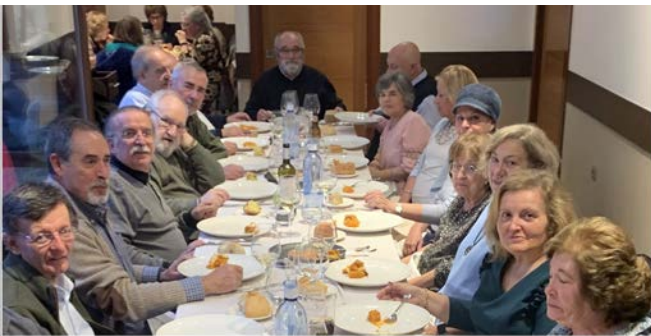
NAVIDAD 2022 ÁVILA