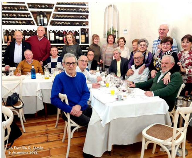
NAVIDAD 2022 PALENCIA