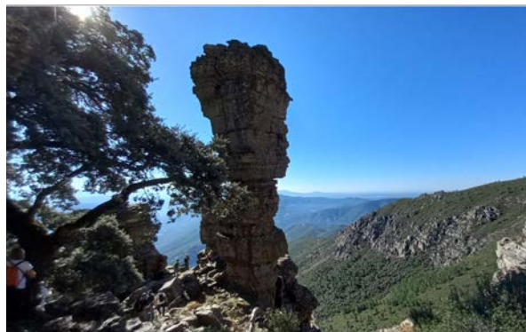
EL PORTILLO DE LAS BATUECAS – PORTILLA BEJARANA – LA TORRITA – LA ALBERCA. 29 septiembre 2023. 12 KM