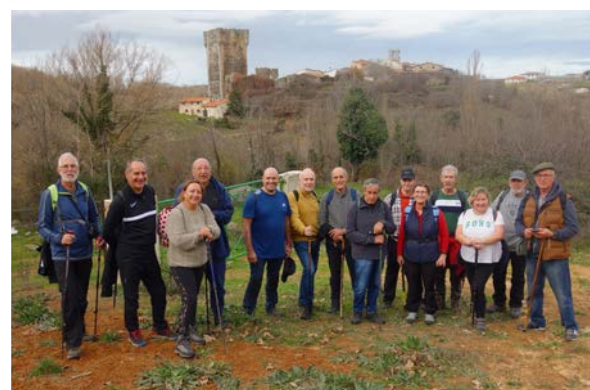
SAN MIGUEL DE VALERO – EL TORNADIZO – OLLAS DE LA SAPA -MONLEÓN Martes 28 de noviembre de 2023 . 16 KM