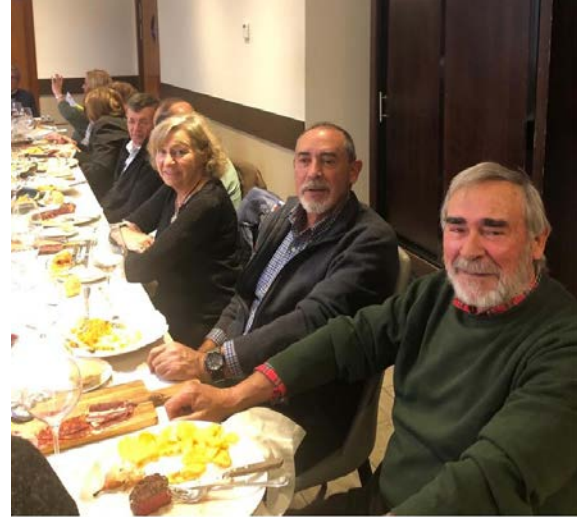
NAVIDAD 2023 ÁVILA