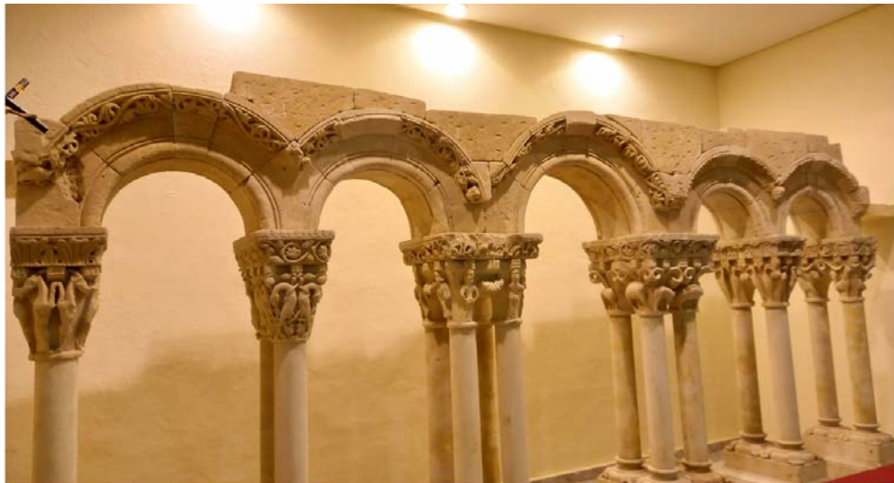
Culturales Iglesia Santa María de la Vega (Fundación Rodrigo Fabrés)