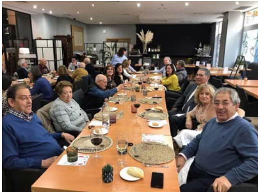
NAVIDAD 2022 VALLADOLID