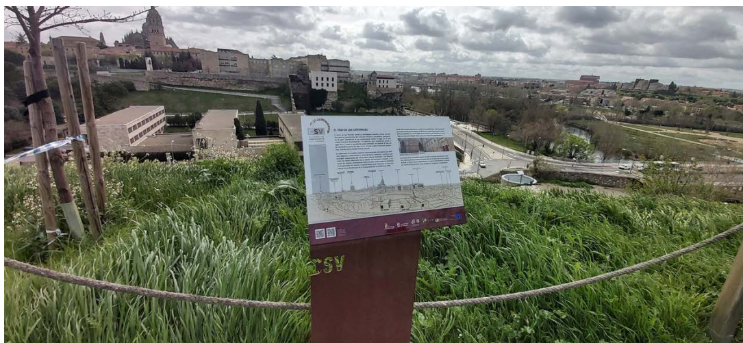
Culturales Cerro San Vicente - 31 mayo 2023