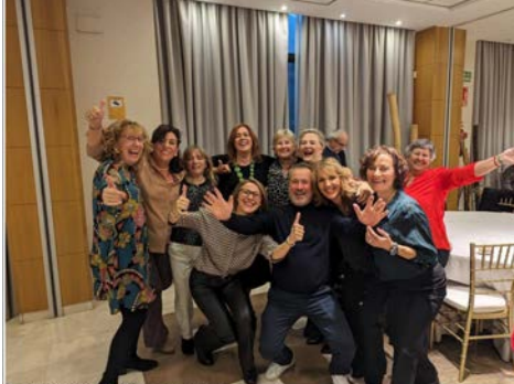
NAVIDAD 2023 SALAMANCA