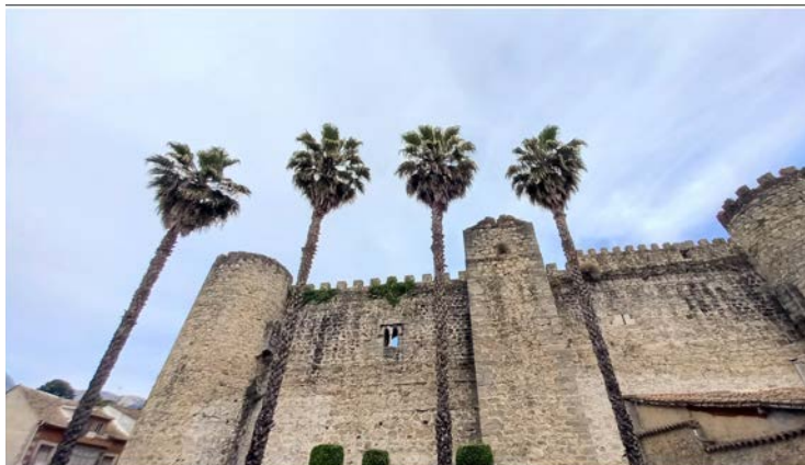
Culturales Arenas de San Pedro - 16 MAYO 2023