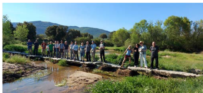
SENDERISMO POR LA RIBERA DEL CORNEJA – 17 de mayo de 2022. Distancia: 16 km