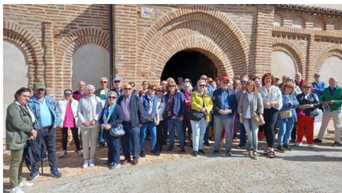
Culturales Iglesias Mudéjares Alba y Peñaranda - 4 mayo 2023