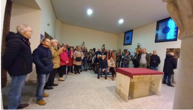
Culturales Iglesia Santa María de la Vega (Fundación Rodrigo Fabrés)