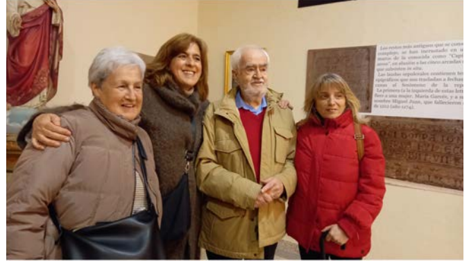
Culturales Iglesia Santa Maria de la Vega (Fundación Rodrigo Fabrés)