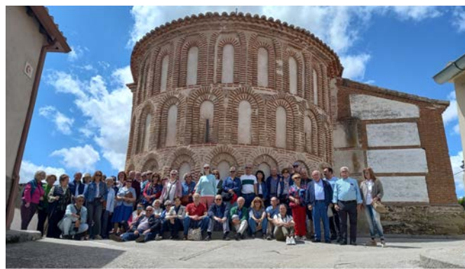
Culturales Iglesias Mudéjares Alba y Peñaranda - 4 mayo 2023