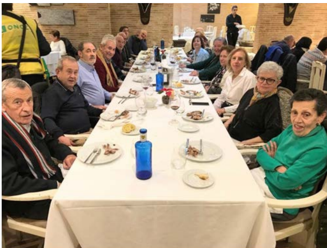
NAVIDAD 2022 SORIA