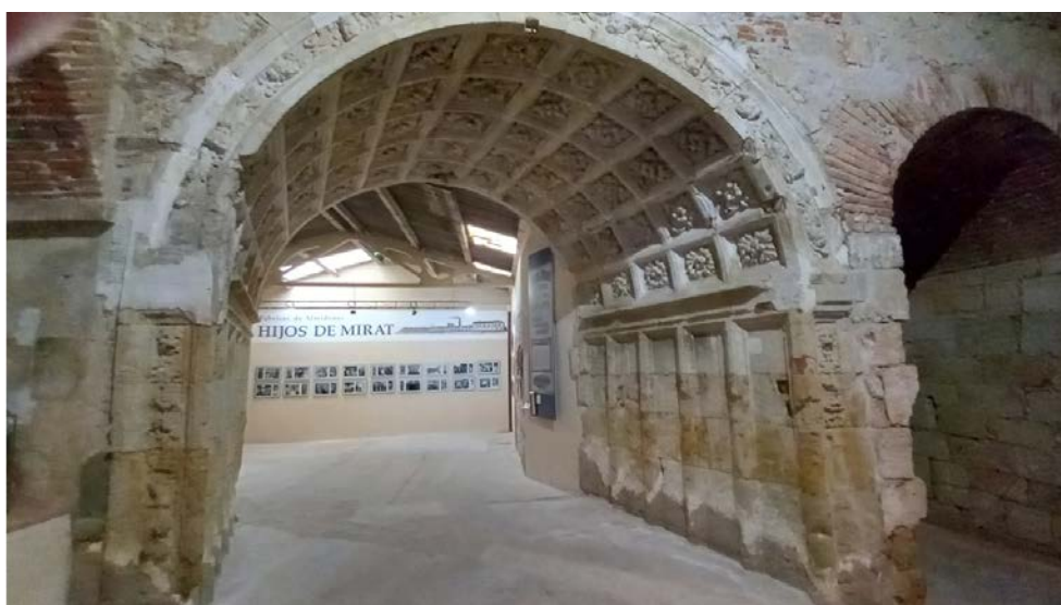
Culturales Fábrica de Mirat - 28 oct 2023