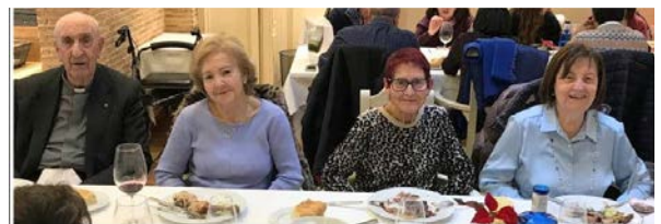
NAVIDAD 2022 SORIA