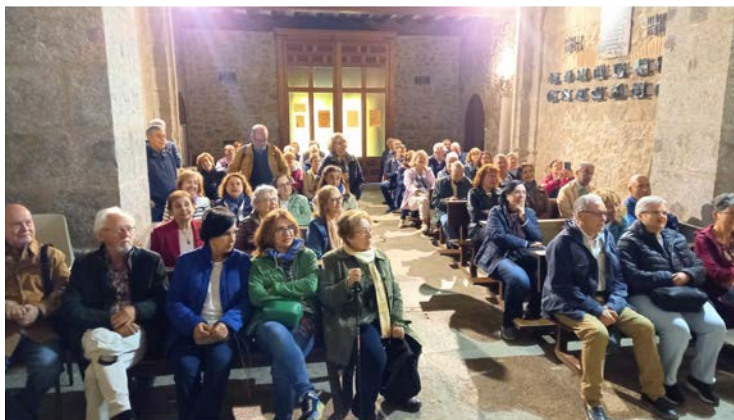
Culturales Arenas de San Pedro - 16 MAYO 2023