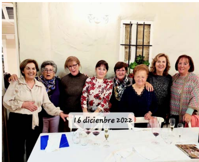
NAVIDAD 2022 PALENCIA