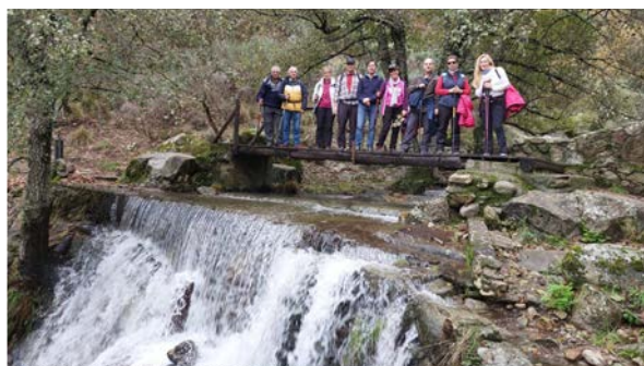
CHORRERA DE HERVÁS (CÁCERES), CASTAÑAR GALLEGO O VIA VERDE. 8 de noviembre de 2023. 14 KM