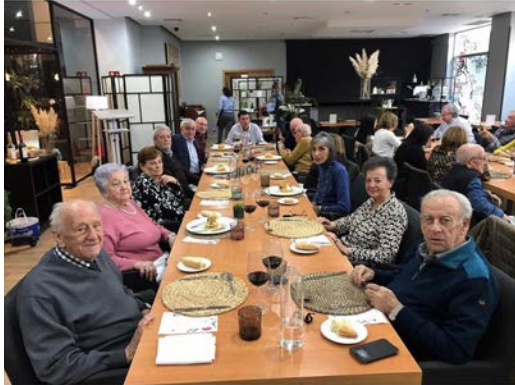
NAVIDAD 2022 VALLADOLID