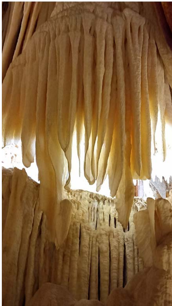
Culturales Arenas de San Pedro - 16 MAYO 2023