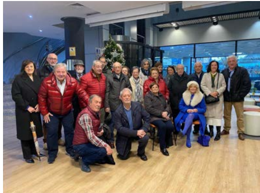
NAVIDAD 2023 VALLADOLID