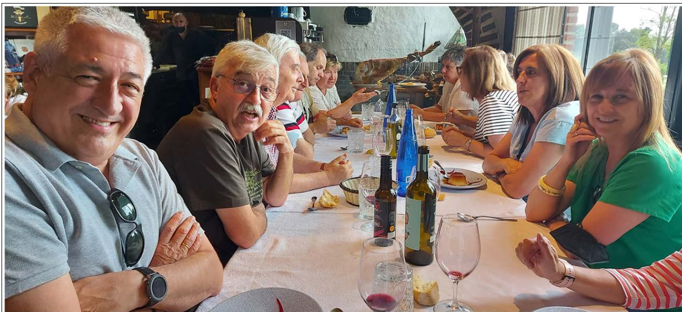
Culturales Madrigal de las Altas Torres 2023