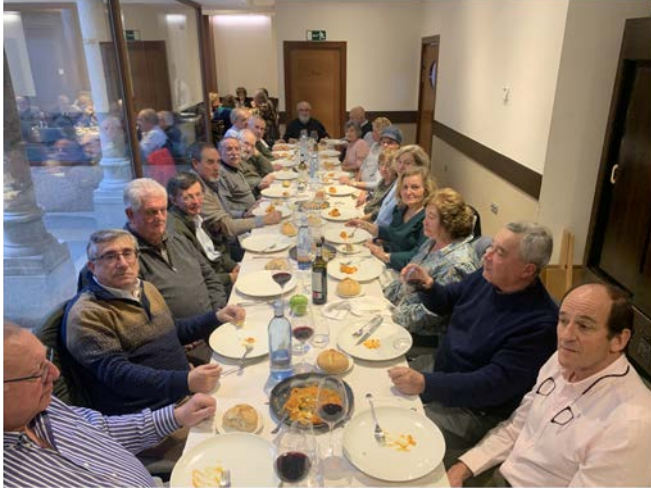
NAVIDAD 2022 ÁVILA