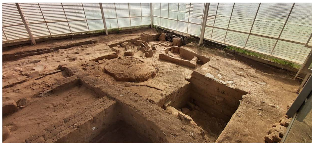
Culturales Cerro San Vicente - 31 mayo 2023