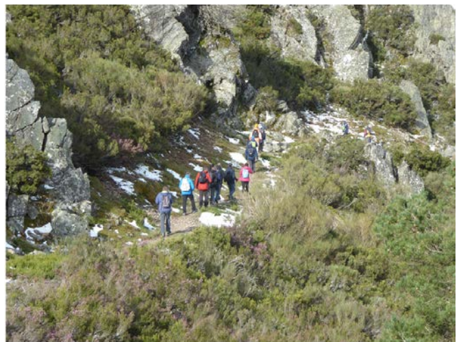
DEL PASO DE LOS LOBOS A MONSAGRO – 21 abril 2022. Distancia: 12 km.