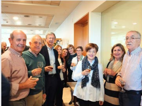
NAVIDAD 2023 SALAMANCA