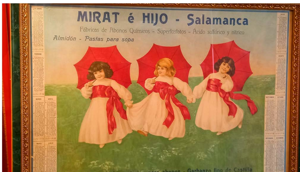
Culturales Fábrica de Mirat - 28 oct 2023