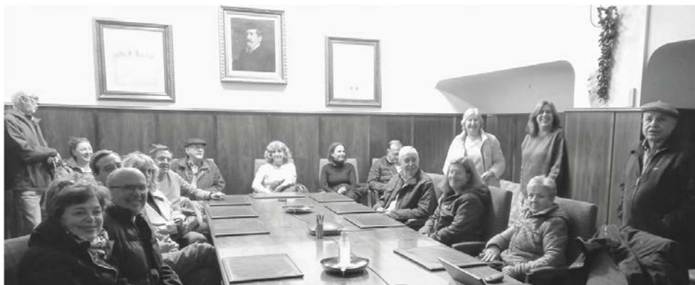
Culturales Fábrica de Mirat - 28 oct 2023