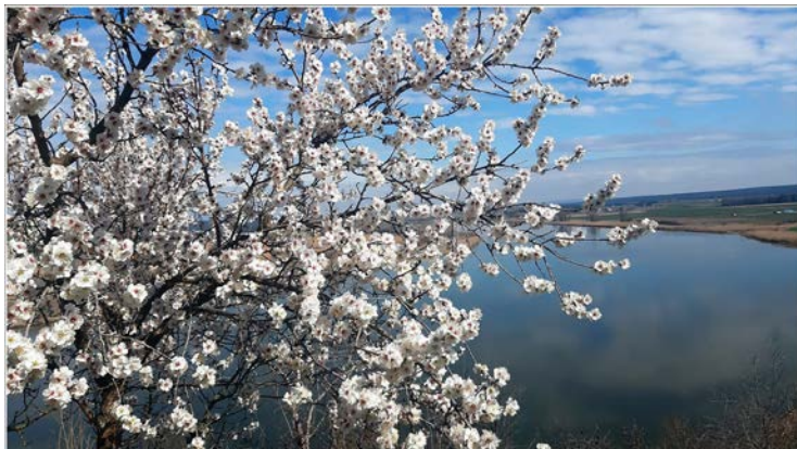
RUTA DE LOS ALMENDROS Y RIVERAS DE CASTRONUNO. 3 de marzo de 2022