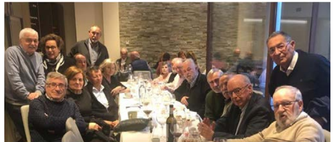
NAVIDAD 2023 ÁVILA