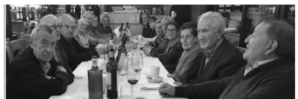
NAVIDAD 2023 SORIA