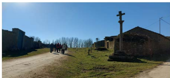
SOBRADILLO [SALAMANCA]: MIRADOR DEL MOLINILLO, MIRADOR DEL TORNO, BURACO Y CACHÓN DE LA DIABLA 1 de marzo de 2023. 12 km