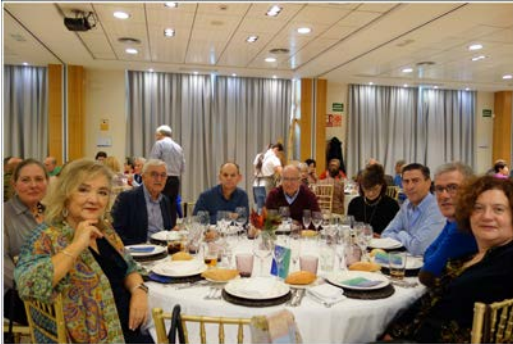
NAVIDAD 2022 SALAMANCA