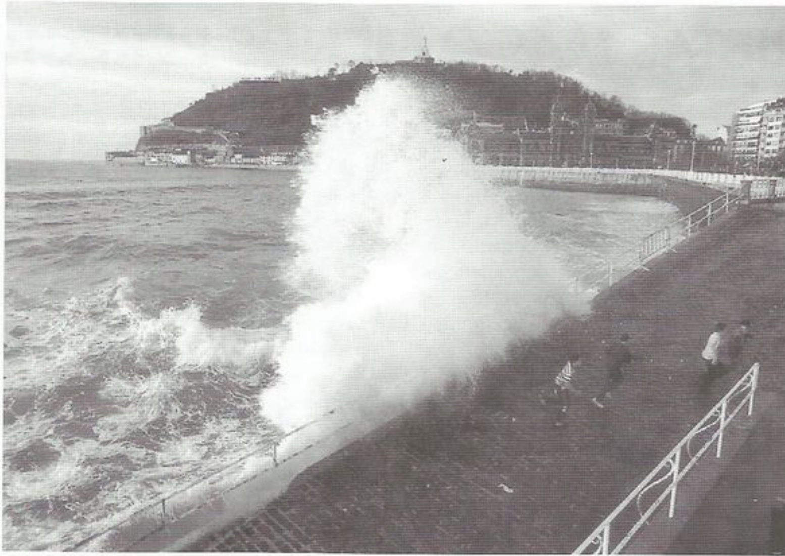
Playa de la Concha. San Sebastián.

aunque se han criado en Castilla, "han visto" tantas veces el mar que seguro cuando lo contemplaron de cerca ya no les podía causar impresión. Ellos tuvieron reloj desde la primera edad...Ellos -los hijos- recorrieron año tras año las distintas costas españolas en el "coche de los papás" disfrutando de las mere-