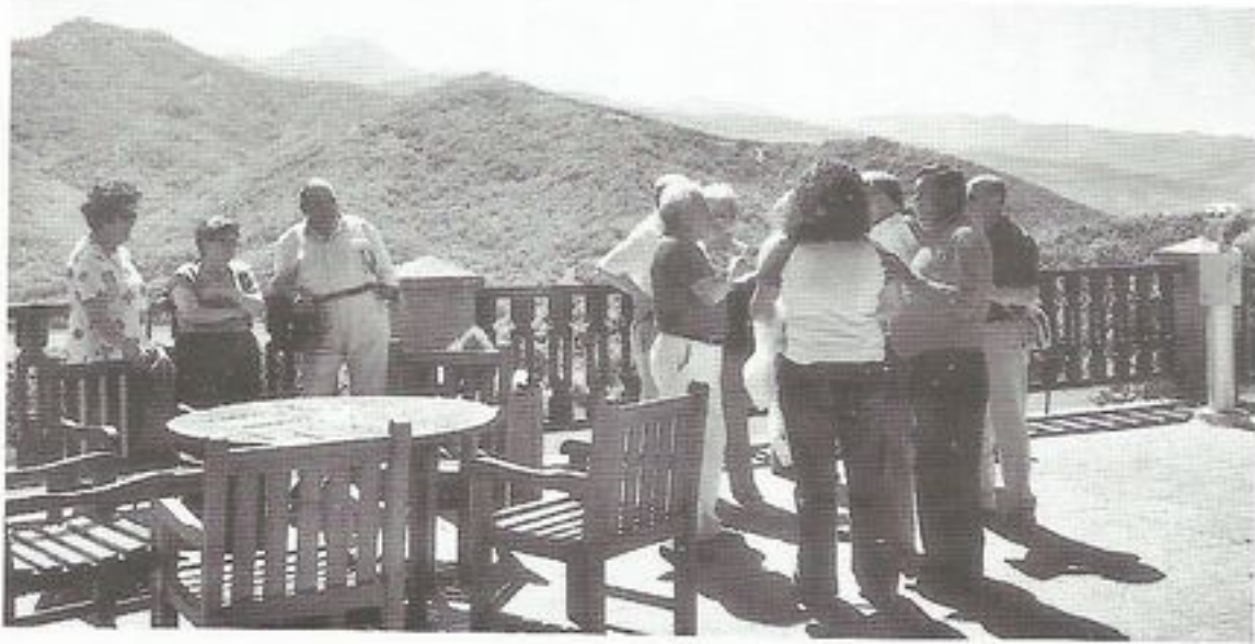
Cervera de Pisuerga. Vista desde el Parador.

sirga y convidados a un trago de "bon vino" escanciado en porrón. A continuación y "en procesión" pasamos a la "humilde mansión" donde el Mesonero Mayor nos dio de "yantar e de