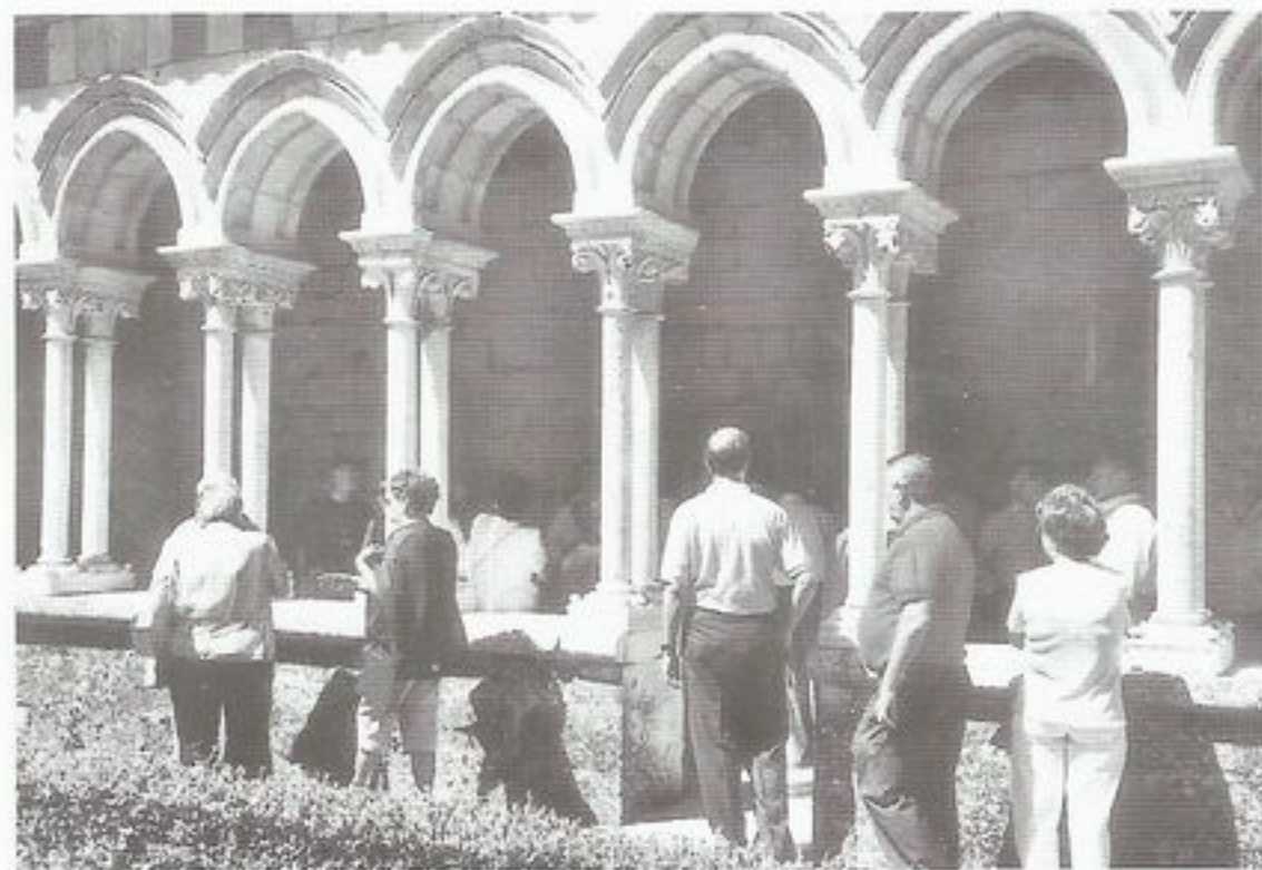
San Andrés del Arroyo. Monasterio.