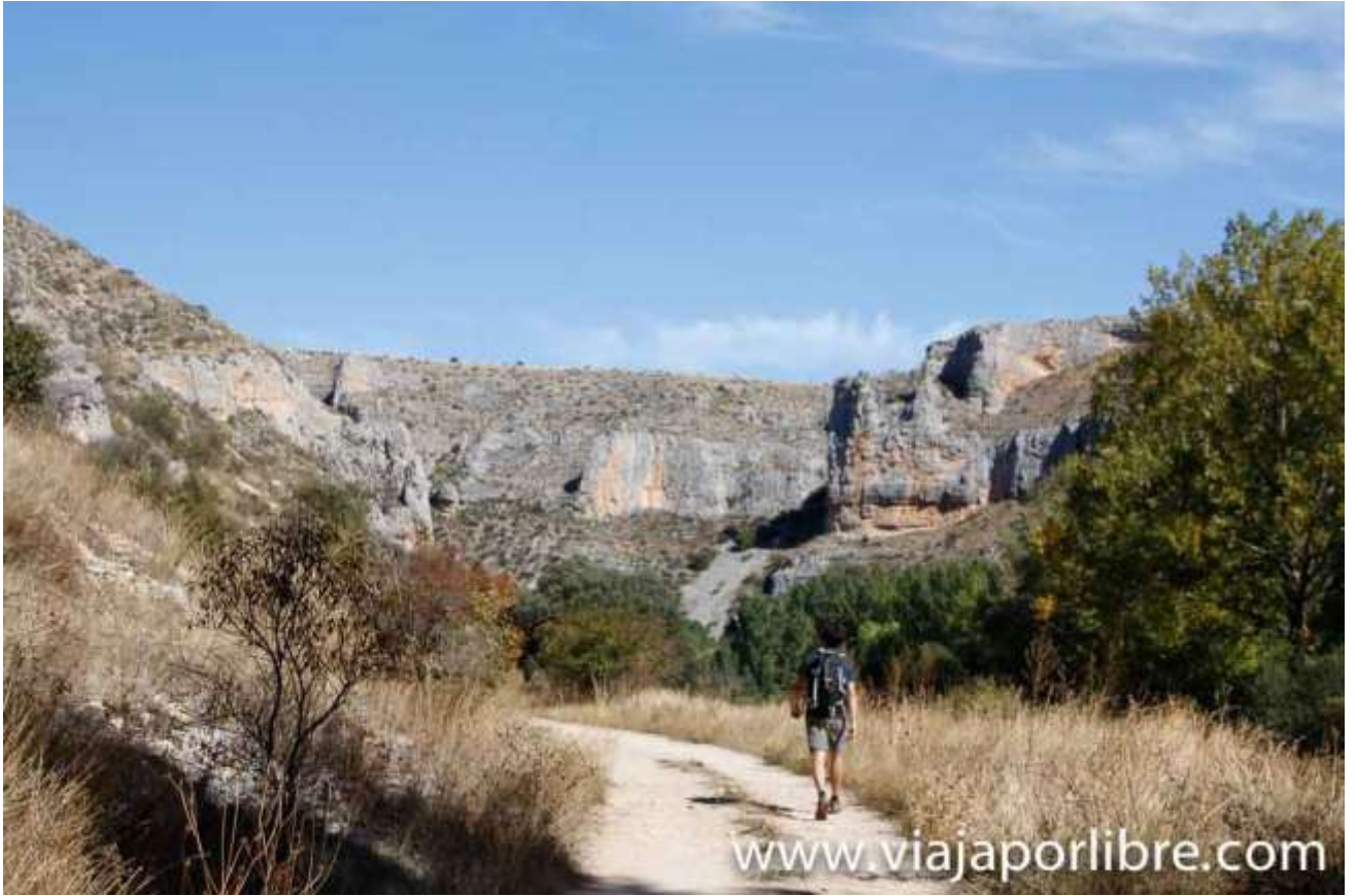
Hoces del Riaza