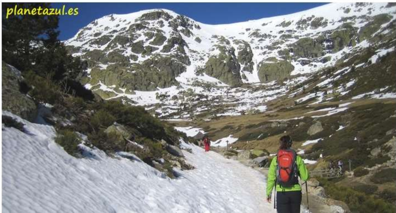
Llegando al Circo de Peñalara.

El sendero nos lleva a pasar junto a la Fuente del Cedrón, última oportunidad para poder coger agua. El sendero termina de bordear la loma y poco a poco va apareciendo delante de nosotros el circo de Peñalara. Son en el circo como guardianes de sus lagunas las cumbres de Dos Hermanas, Hermana Menor (2.271 m.) y Hermana Mayor (2.280 m.) y el pico Peñalara, el más alto de la sierra de Guadarrama con sus 2.428 m.