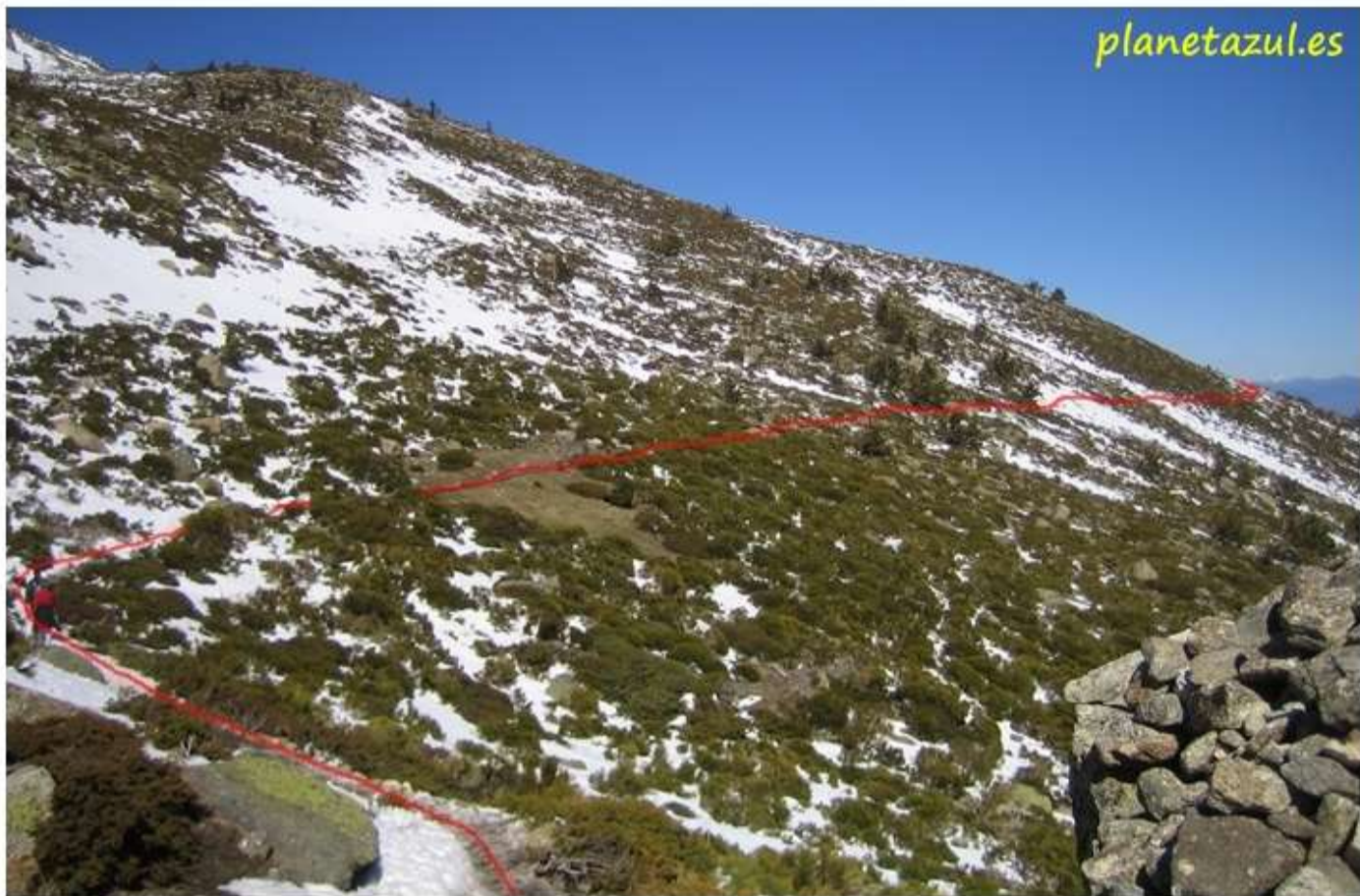
Tras cruzar el puente y subir un pequeño repecho el camino llanea en busca de la laguna.

Tras bordear ésta última loma, aparece ante nosotros una hondonada hacia la que nos dirige el sendero. Volver a remontarla y alcanzar una terraza donde se asientan varias lagunas, entre ellas, nuestro objetivo: Laguna de los Pájaros.