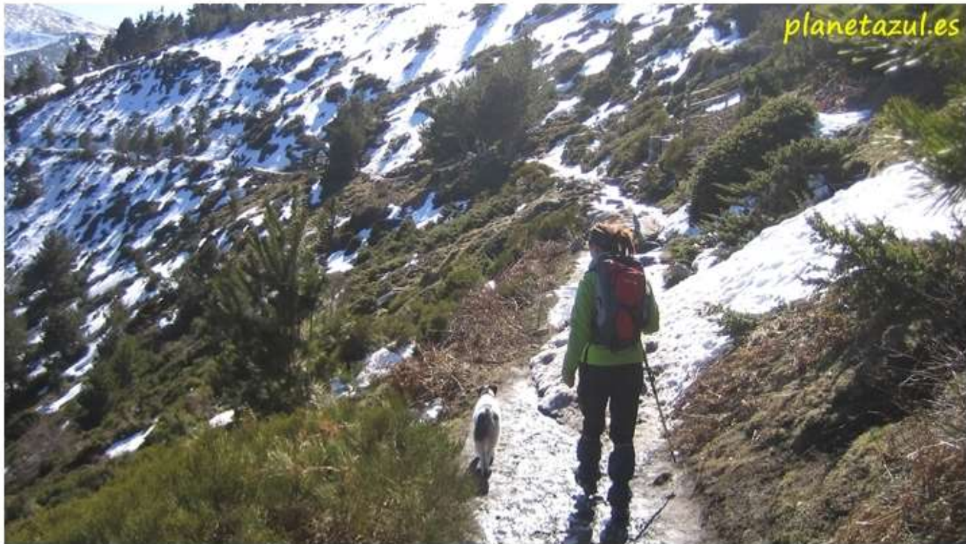
Camino de las Lagunas de Peñalara.

El sendero nos lleva a pasar junto a la Fuente del Cedrón, última oportunidad para poder coger agua. El sendero termina de bordear la loma y poco a poco va apareciendo delante de nosotros el circo de Peñalara. Son en el circo como guardianes de sus lagunas las cumbres de Dos Hermanas, Hermana Menor (2.271 m.) y Hermana Mayor (2.280 m.) y el pico Peñalara, el más alto de la sierra de Guadarrama con sus 2.428 m.