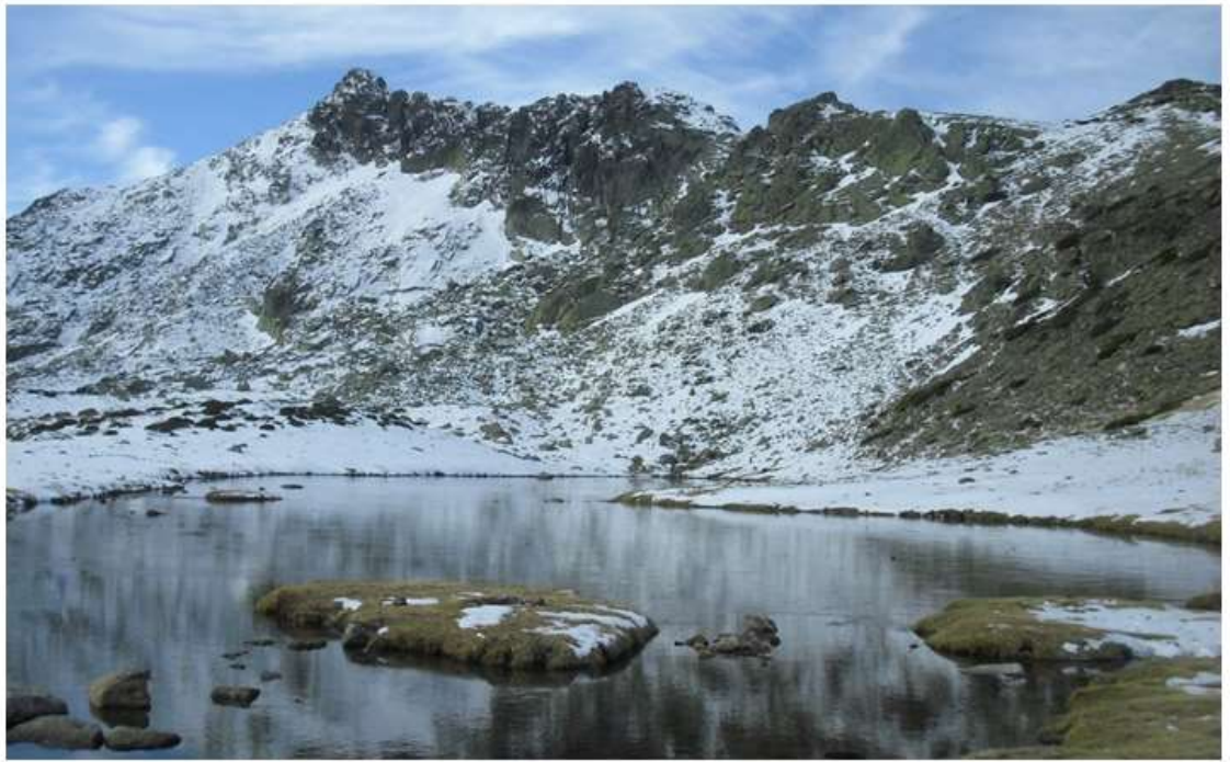
Laguna de los Pájaros a los pies del Macizo de Peñalara.

Alcanzada la citada terraza podemos observar a nuestra derecha la Laguna de los Claveles, y más adelante un agradable paseo y sin ninguna dificultad llegamos a la Laguna de Los Pájaros. En primavera ésta muestra unas hermosas y verdes praderas donde poder comer plácidamente sentados junto a la laguna. En invierno encontraremos nieve en buena parte del recorrido y la laguna muy probablemente se encuentra helada.