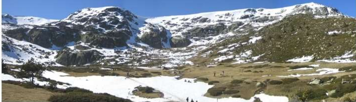
Circo y lagunas de Peñalara.

Ésta ruta nos dará a conocer el Parque Natural de Peñalara y sus alrededores donde se asientan varias lagunas que cercioran su origen glaciar, entre ellas, la Laguna de los Pájaros, nuestro objetivo en ésta excursión. Esta zona, junto con el resto de la Sierra de Guadarrama ha sido declarada Parque Nacional el 27 de Junio de 1989.