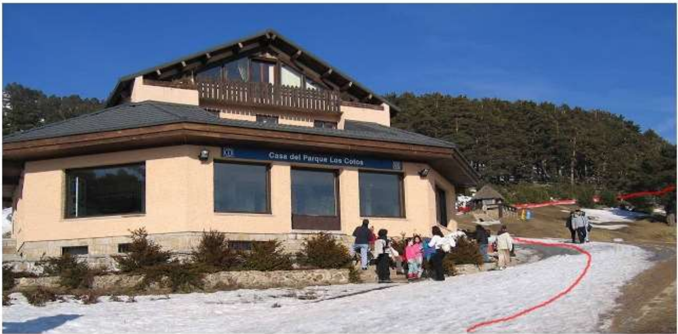
Casa del Parque en el Puerto de Cotos. Inicio de la ruta.

Partimos del parking del Puerto de Cotos y nos dirigimos hacia la Casa del Parque que vemos al otro lado de la carretera. Es el centro de información del Parque Natural de Peñalara donde podemos obtener información de ésta y otras rutas por el parque. Seguimos el camino empedrado que sale a la derecha de ésta casa que unos metros se convierte en un camino ancho de tierra que va subiendo entre los pinos y donde encontramos a nuestra izquierda la Fuente Cubeiro. Unos metros más arriba, en una curva que gira a la izquierda, encontramos el Mirador de la Gitana desde el que podemos observar una buena panorámica de la Cuerda Larra.