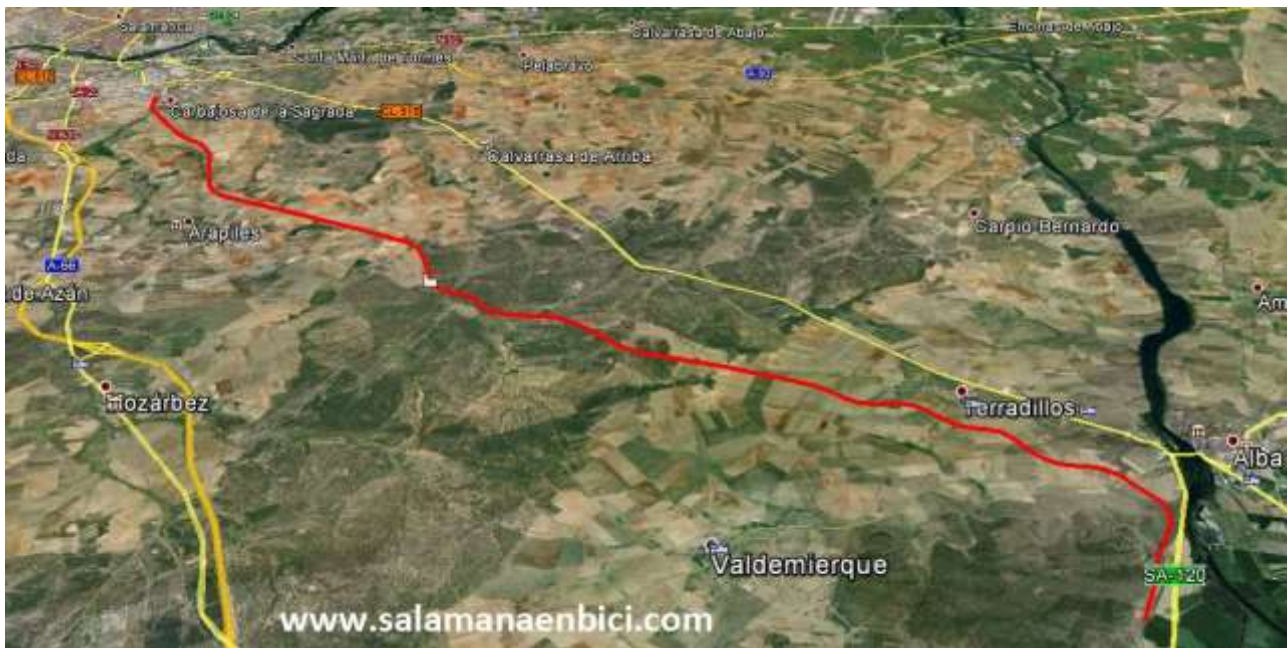
En rojo se indica el trazado de la futura vía verde entre Carbajosa y Alba de Tormes.

Desde entonces, la vía y la mayor parte de las infraestructuras de Renfe son pasto del paso del tiempo y, en definitiva, del abandono de todas las administraciones, especialmente en Castilla y León y Extremadura. Llama la atención que, mientras en otras comunidades algunos de estos caminos de hierro "obsoletos" se han reinventado bajo el epígrafe de vías verdes , la ruta ferroviaria de la Plata permanezca aún hoy, 25 años después (este año celebramos el cuarto de siglo desde el cerrojazo), a la espera de decisiones y apuestas con perspectiva y valentía.