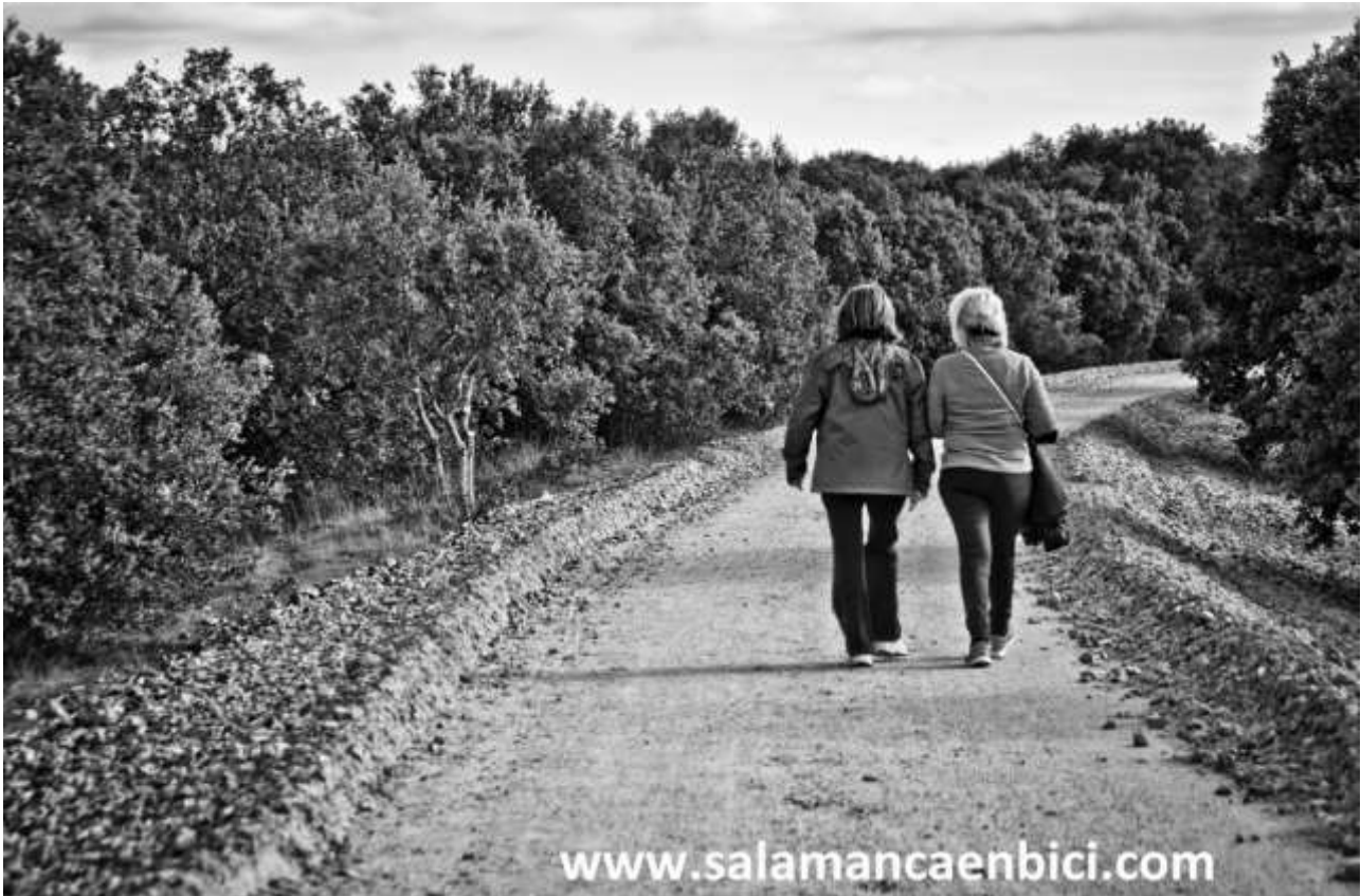
Aspecto general del camino sobre la vía.

permanece camuflada bajo las raíces y un prolijo sotobosque que poco a poco ha ido entretejiendo una vía verde y natural sobre los hierros y cuyo futuro sigue siendo incierto.