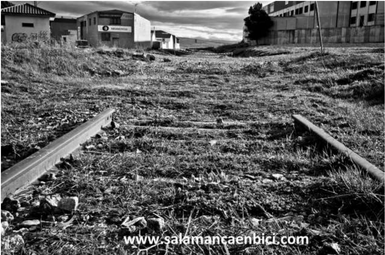
Lugar en el que se han retirado los raíles para la reconversión de la vía en camino (Carbajosa)

Nos asaltan preguntas y reflexiones que queremos compartir con todas vosotras: