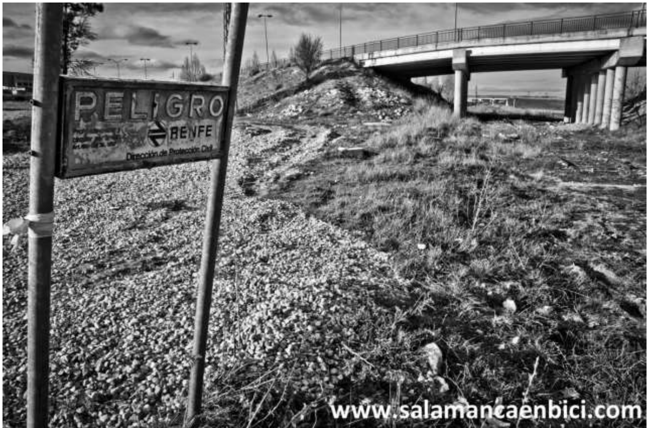
Extremo de la vía en Carbajosa con advertencias caducas.

Desde entonces, la vía y la mayor parte de las infraestructuras de Renfe son pasto del paso del tiempo y, en definitiva, del abandono de todas las administraciones, especialmente en Castilla y León y Extremadura. Llama la atención que, mientras en otras comunidades algunos de estos caminos de hierro "obsoletos" se han reinventado bajo el epígrafe de vías verdes , la ruta ferroviaria de la Plata permanezca aún hoy, 25 años después (este año celebramos el cuarto de siglo desde el cerrojazo), a la espera de decisiones y apuestas con perspectiva y valentía.